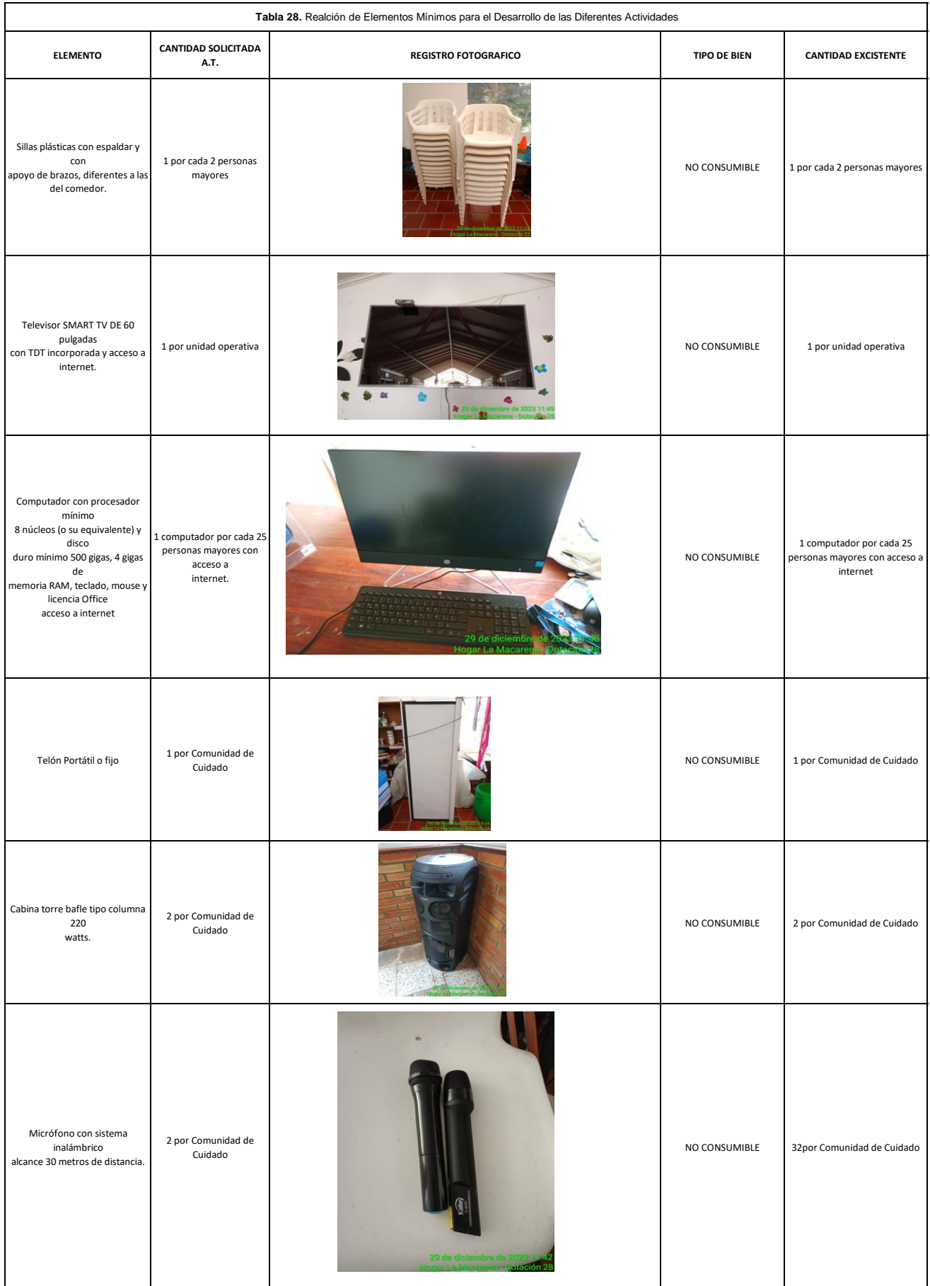
Tabla 28. Reación de Elementos Mínimos para el Desarrollo de las Diferentes Actividades